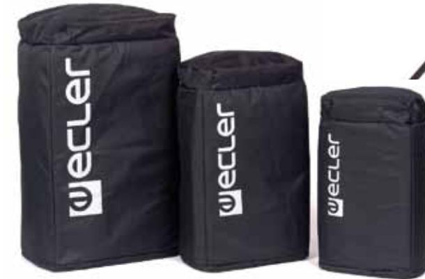
BAGVERSO8, BAGVERSO10, BAGVERSO12